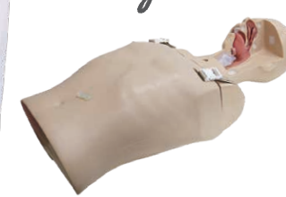
新人研修で使用されるモデル 繰り返し練習できるので安心♡