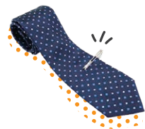
父親から貰った ネクタイピン