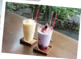
右から「ベリースムージー」(税込 715 円) 「ミックスジュース」(税込 660 円)