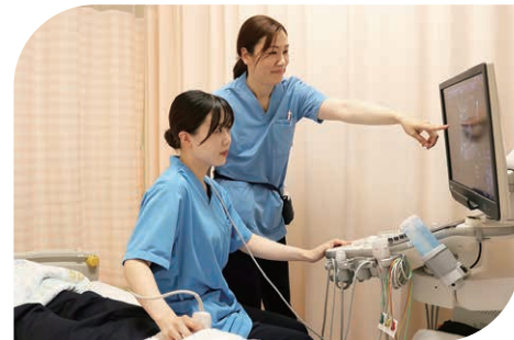
先輩からのエコー練習指導