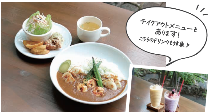
「シーフードライスカレーセット」(税込 1,265 円) スープ・サラダ・フライドチキン・フライドポテト付