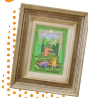
孫の誕生に合わせて 記念に購入した なむひし 名村 仁さんの組み絵