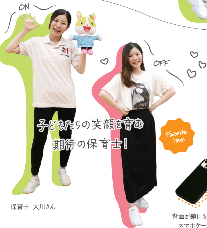
背面が鏡にもなる スマホケース

友達とドライブを兼ねて海へ行くことが多いです。見ていると気持ちが落ち着くので、季節関係なく長い時間話し込むことも。